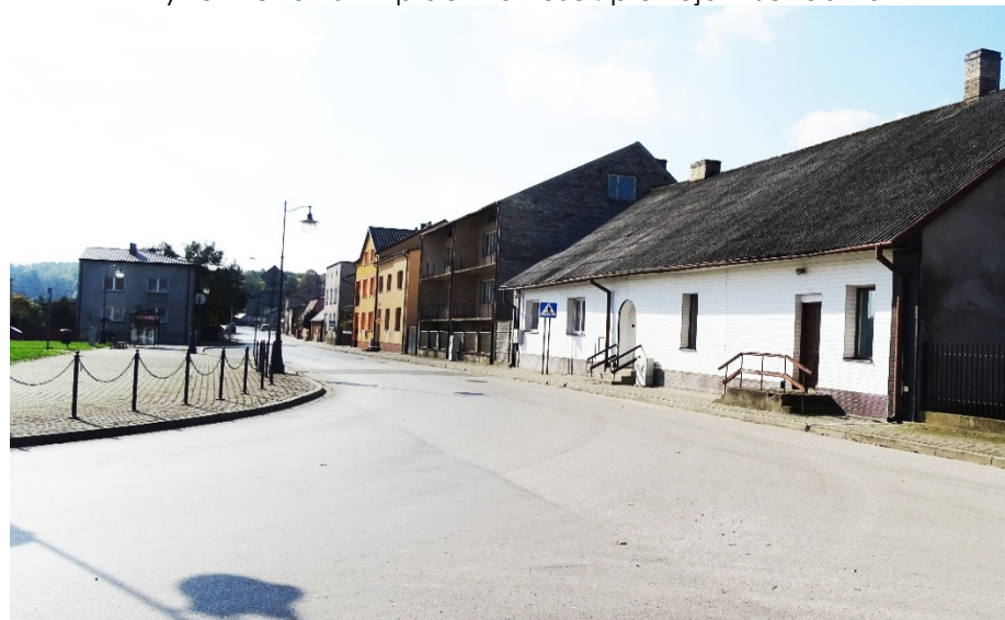
Rynek kunowski – plac Wolności: pierzeja zachodnia