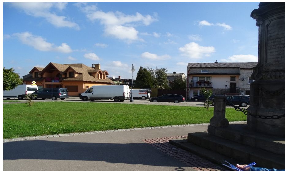
Rynek kunowski – plac Wolności: pierzeja wschodnia