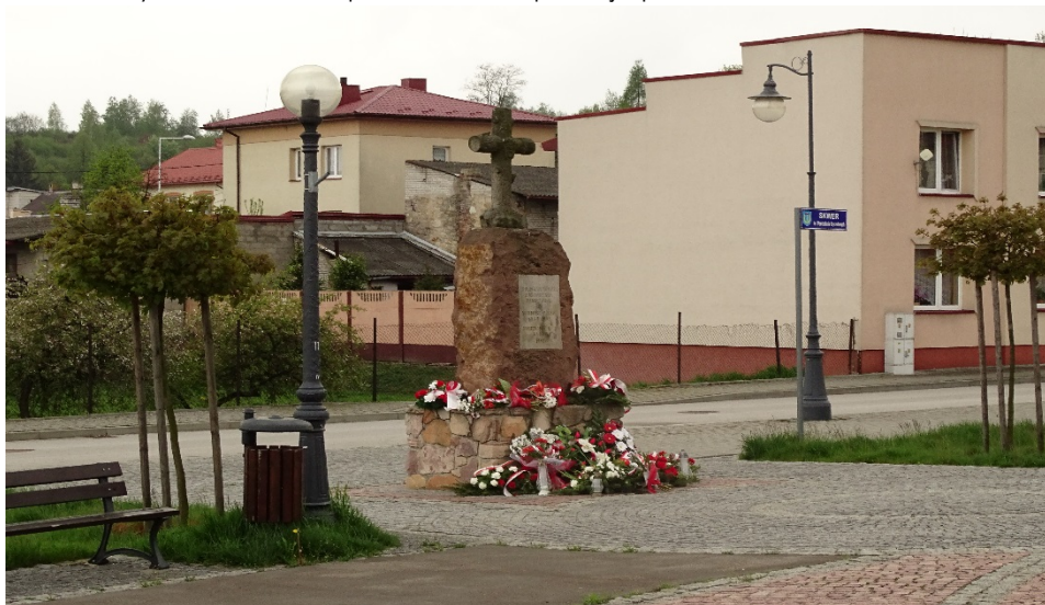
Rynek kunowski – plac Wolności: frag. pierzei południowej