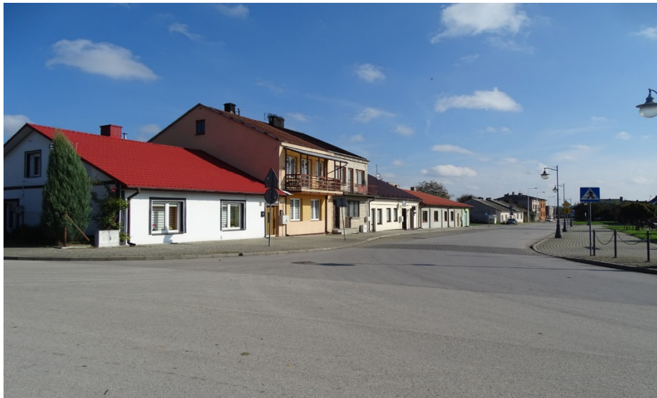
Rynek kunowski – plac Wolności: pierzeja północna od zachodu