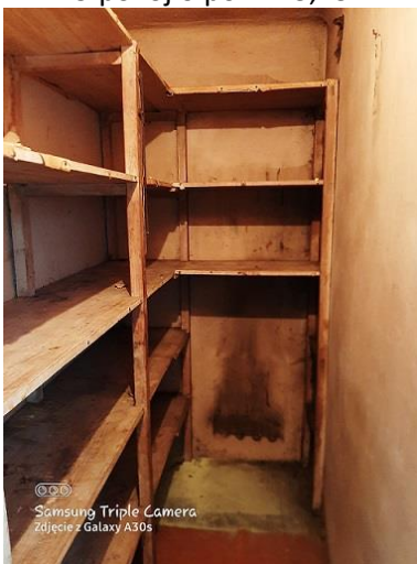
2.13 spiżarnia o pow. 2,33 m 2