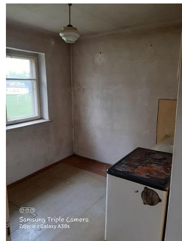
2.12 kuchnia o pow. 7,05 m 2