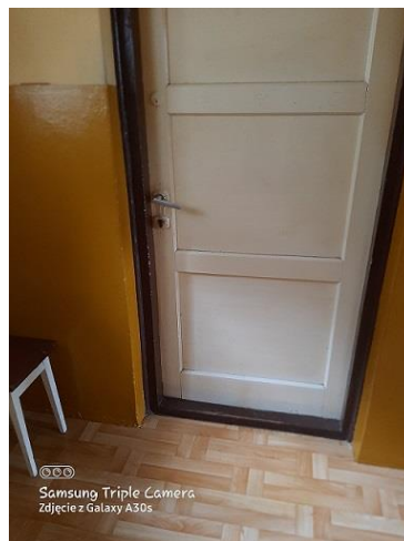
wejście do lok. Nr 4