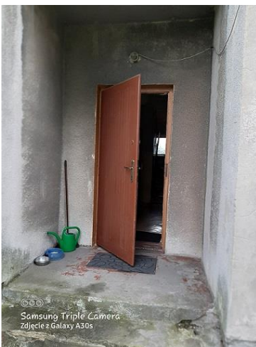
wejście do budynku

Wykończenie lokalu mieszkalnego: podłogi – deski drewniane w pokojach, przedpokoju, kuchni; łazienka – stare płytki; okna – drewniane; stolarka drzwiowa wewnątrz lokalu mieszkalnego – płytowo-szklana. Lokal wymaga kapitalnego remontu.