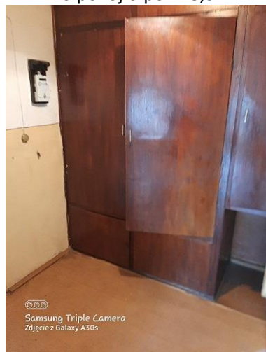
2.8 przedpokój o pow. 2,33 m 2