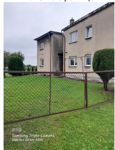
budynek, w którym usytuowany jest lokal