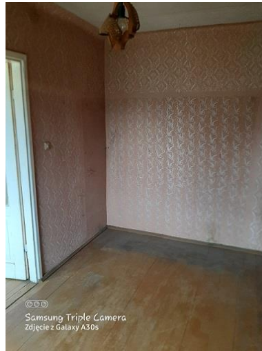
2.10 pokój o pow. 8,3 m 2