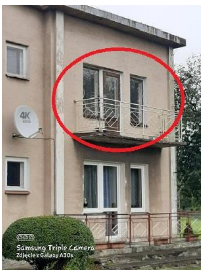
oznaczenie lok. z zew.

Lokal mieszkalny zlokalizowany jest na nieruchomości gruntowej zabudowanej budynkiem Domu Nauczyciela, oznaczonej numerem ewidencyjnym 1270/2 o pow. 0,1092 ha, położonej w obrębie 0001 - Kunów-Miasto.