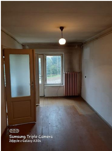
2.9 pokój o pow. 13,13 m 2