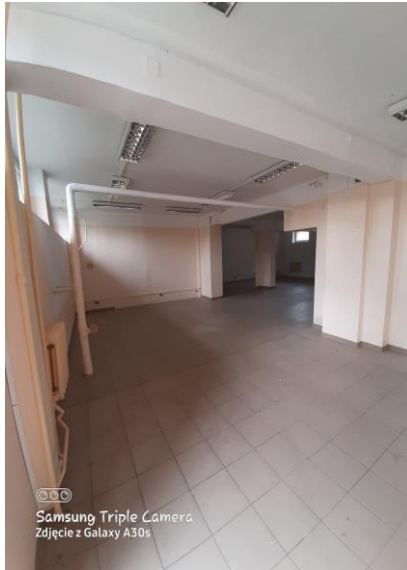
03 - sklep o pow. 18,4 m 2