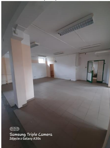
01 - sklep o pow. 86,52 m 2