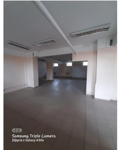
03 - sklep o pow. 18,4 m 2