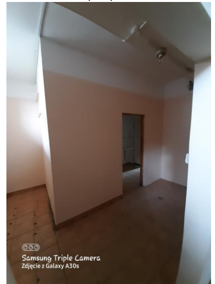
04 - zaplecze o pow. 17,3 m 2