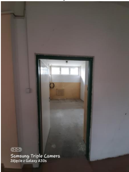
02 – magazyn 13,3 m 2