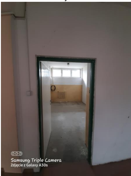
02 – magazyn 13,3 m 2